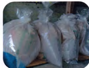
米袋、ビニール袋に入れる