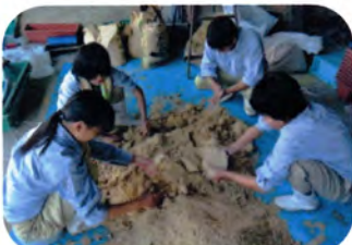
保温器から取り出し塊を崩す