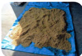
広げて2日間乾燥させる