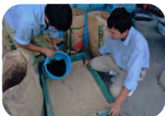
容器に材料を全て入れる