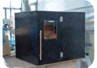
保温器35℃で10日間保存