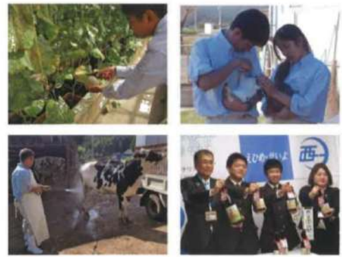
畜産科 令和3年度教育課程構造図