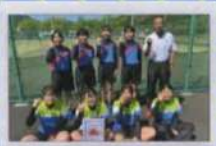
女子ソフトテニス部