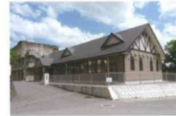
野村高校同窓会館「あやぐも館」

野村高校で学ぶ生徒の学習支援のため、西予市が運営する塾です。西予市の地域おこし協力隊3名が中心となり、学習や進路実現を手厚くサポートします。